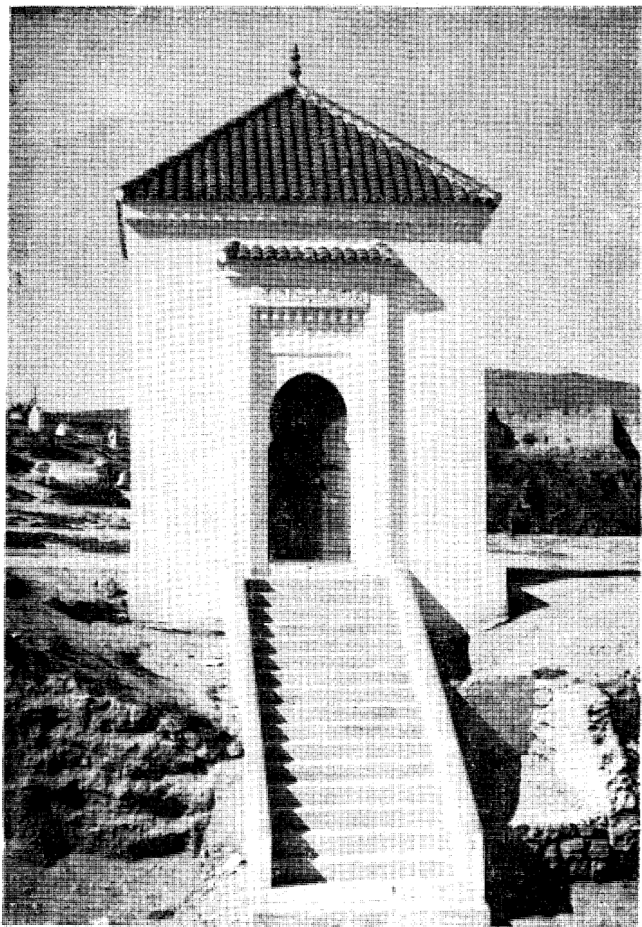
قبر لسان الدين بن الخطيب باب المحروق في فاس كما هو اليوم